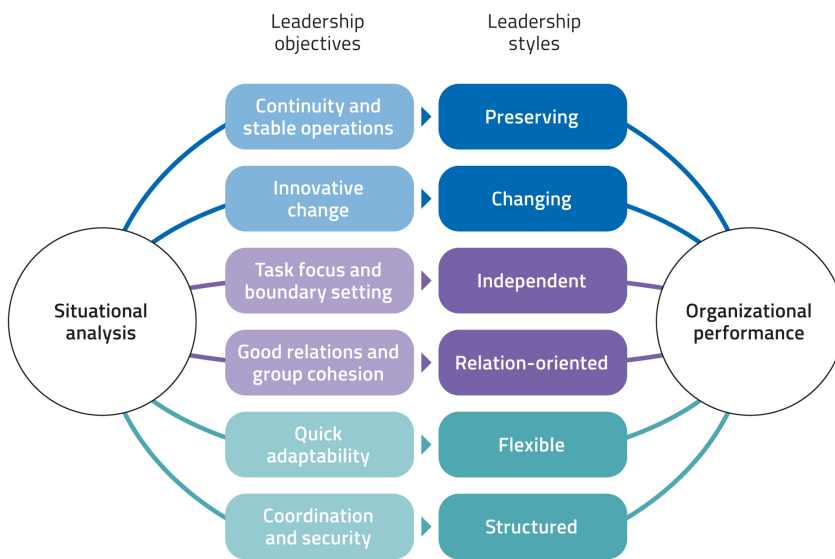
The Strategic Leadership Style Model.